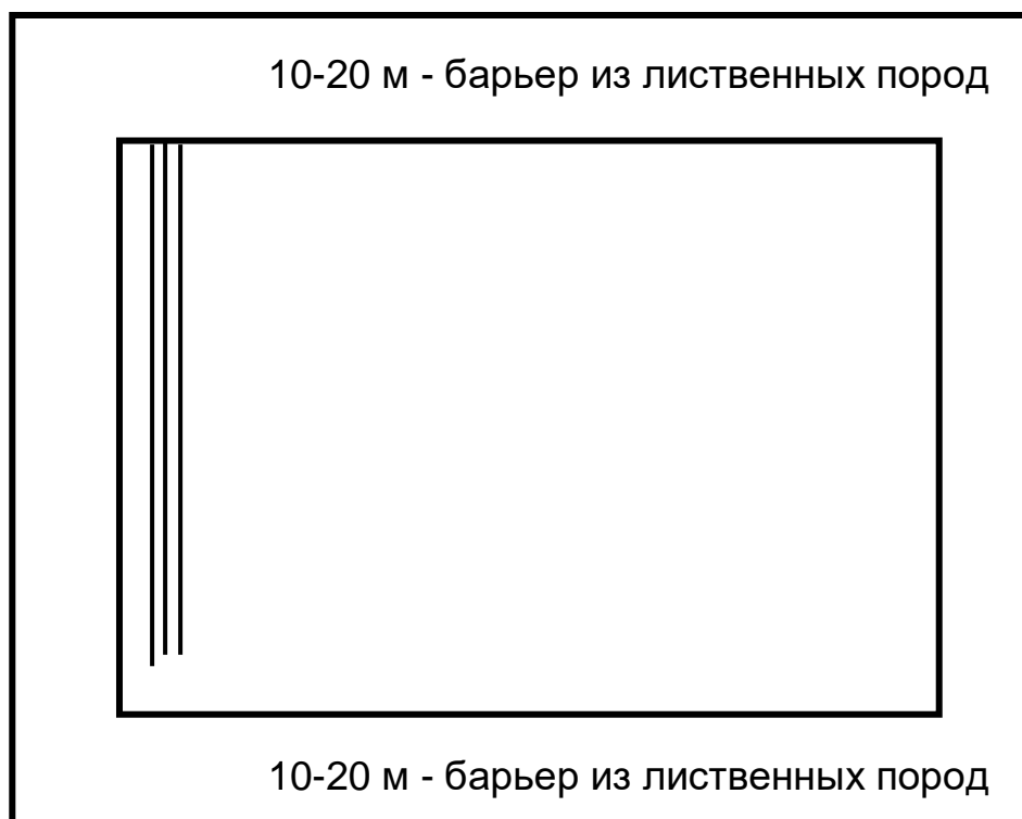
Рисунок 1 - Схема размещения лесных пород

При посадке лесных культур саженцами, сеянцами с закрытой корневой системой допускается снижение количества высаживаемых растений до 2,0 тысяч штук на 1 гектаре (для саженцев дуба с закрытой корневой системой до 1,0 тысячи штук на 1 гектаре).