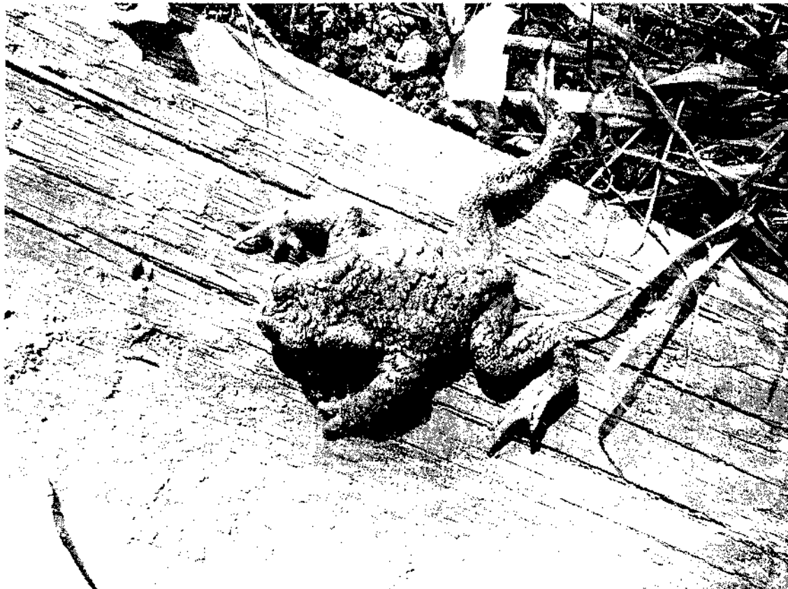
Фото 3. Серая жаба