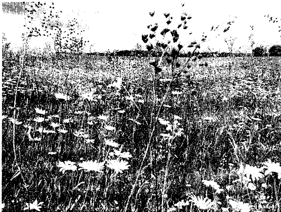
Фото 2. Карыжский луг