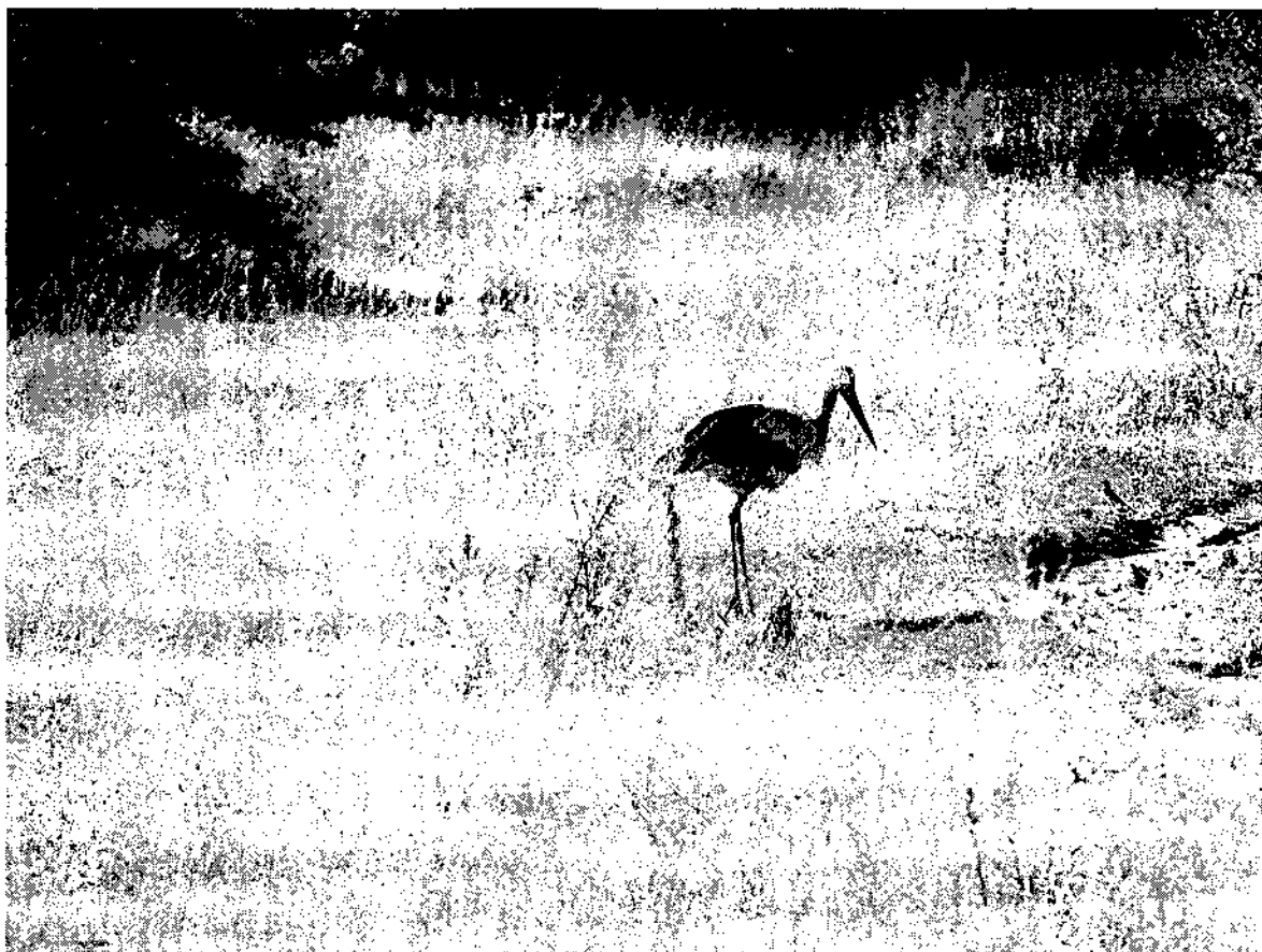
Фото 4. Белый аист