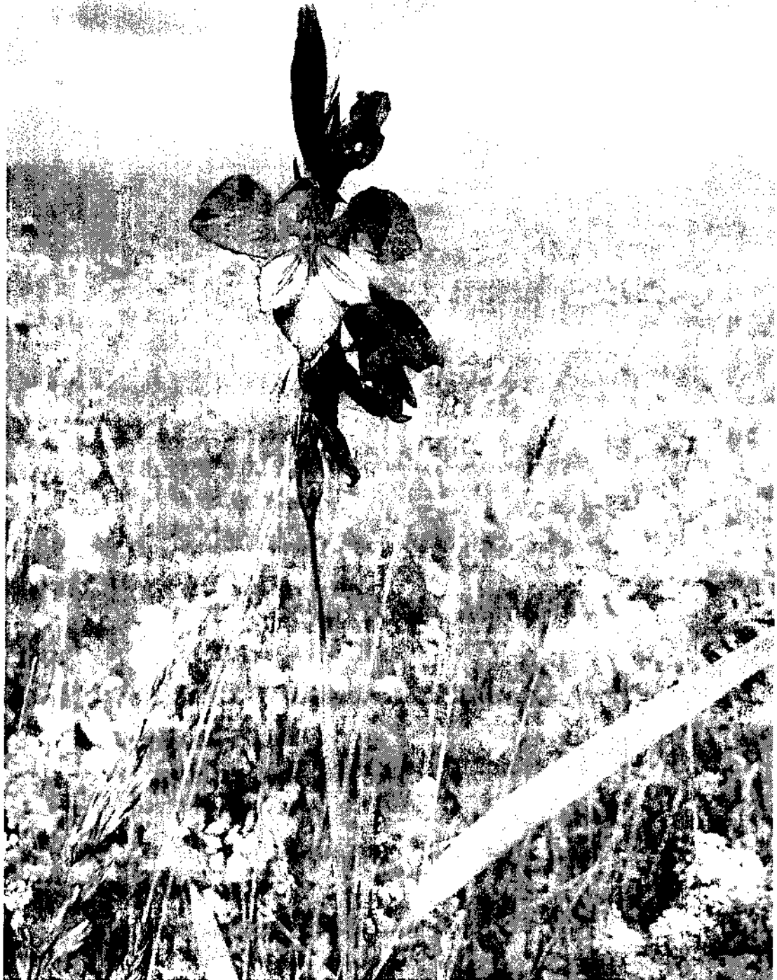
Фото 1. Гладиолус (шпажник тонкий)